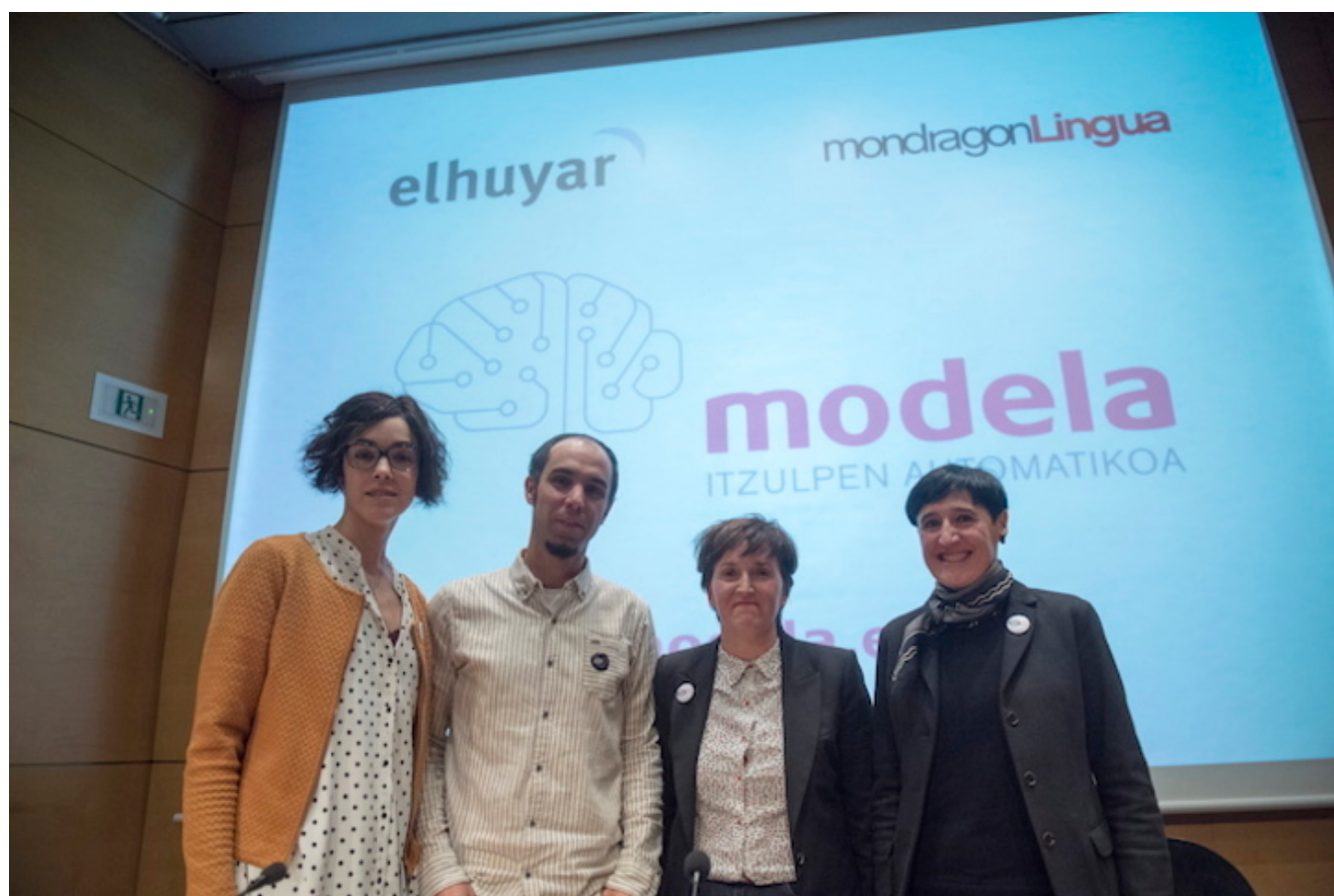
'Modela' itzultzaile automatiko «iraultzailearen» aurkezpena, Donostian.

Euskarararen eta gaztelaniaren arteko itzulpen automatikoko «sitemarik onena» eskura daukate dagoeneko erabiltzaileek.